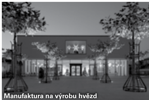
Manufaktura na výrobu hvězd