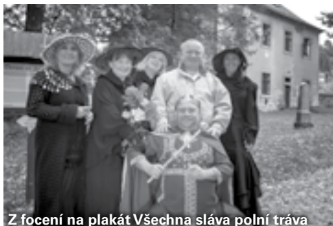
Z focení na plakát Všechna sláva polní tráva