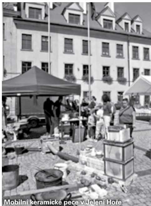
Mobilní keramické pece v Jelení Hoře

Díky podpoře OHK v Jablonci nad Nisou proběhne soutěž všech sklářských firem, které se prezentují na Skleněném městečku. Vyhlášený budou tři kategorie: INOVATIVNÍ PRODUKT (nejzajímavější výrobek), NEJLEPŠÍ EXPOZICE (hodnotí se nápaditost, způsob prezentace a vystavení výrobků) a ŘEMESLO NA ŽIVO (hodnotí se interaktivita, ukázky sklářské výroby, řemeslná dílna). Vyhlášení a předání cen proběhne 21. 9. 2014 v poledne na Malém náměstí za účasti představitelů OHK v Jablonci nad Nisou, Města Železný Brod a SUPŠS Železný Brod.