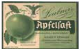
Etiketa jablečného moštu z kunratické továrny.