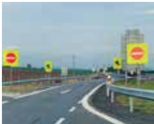
Nové značky varují řidiče před jízdou v protisměru.

Nově instalované značky s motivem varovně vztyčené dlaně mají zabránit vjíždění řidičů do protisměru. První značka tohoto typu byla umístěna u sjezdu z dálnice D10 nedaleko obce Příšovice. S podob-