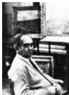
malíř a spisovatel