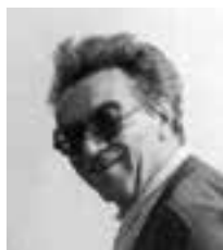
lékař působící v Železném Brodě v 70. – 80. letech