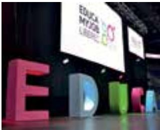
Motiv z veletrhu Educa.

Čtrnáctý ročník veletrhu Educa Myjob Liberec 2020 se uskuteční od 15. do 17. října v libereckém Home Credit Aréně pod záštitou ministra školství, mládeže a tělovýchovy Roberta Plágy a hejtmána