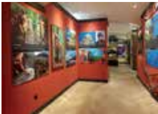
Unikátní výstava odhaluje život, zvyky a krásy tajemné Indonésie.

Největší výstava svého druhu ve střední Evropě odkrývá tajemství i krásy Indonésie, kterou podpořil i Liberecký kraj, je umístěna v Centru Babylon v Liberci. Expozice odhaluje zajímavosti ostrova Nová Guinea i celé Indonésie, Pacifiku a Šalomounových ostrovů. Návštěvníci se seznámí s nevšedními poznatky z výprav slavných cestovatelů