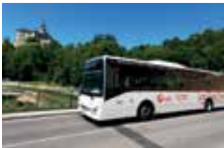
Nová víkendová linka propojila tři státy.

Unikátní autobusová linka č. 691 propojila české, německé a polské pohraničí. Každý víkend jede po trase Hrádek nad Nisou – Zittau – Bogatynia – Frýdlant – Nové Město pod Smrkem – Świeradów-Zdrój a zpět. Jízdné je možné hradit v korunách, zlotých nebo eurech. Až do 22. listopadu platí speciální propagační zvýhodněné jízdné, ale do budoucna se počítá s klasickým jízdným IDOL. Provoz autobusů zajišťuje krajský dopravce ČSAD Liberec a veškeré informace o spoji najdete na www.iidol.cz/bus691 .