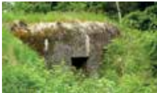
Bunkr lehkého opevnění na pomezí Jizerských hor a Krkonoše.

pod rozhlednou Štěpánka, si návštěvníci mohou prohlédnout v červenci a srpnu od úterka do neděle v čase 9–18 hodin. Více informací o muzeu na www.bunkrynapomezici.cz .