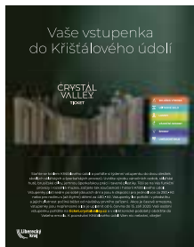
Vstupenka do Křišťálového údolí.

Kromě již zmíněné vstupenky se chystají i další zajímavé novinky. Například hned o prvním červencovém dni se v jablonecké firmě GB Beads otevře nová Expozice českého sklářství a bižuterie. Dále doporučuji návštěvu taktéž jabloneckého Palace Plus, kde se ve dnech 4. až 7. července bude konat dílna inspirace s kurzy profesionálních bižuterních technik pro dospělé. A když jsme u Palace Plus, tak ani v letošním roce nebude chybět velmi oblíbená