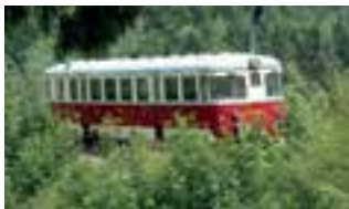
Motorový vůz M240.021, tzv. Singrovka, jezdí na ozubnicové trati při nostalgických jízdách.

O prázdninách chystá Železniční společnost Tanvald akce na jediné české ozubnicové trati z Tanvaldu do Kořenova a Harrachova. Těšit se můžete na nostalgické jízdy s unikátními ozubnicovými