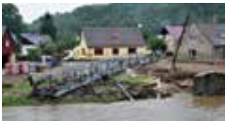
Zničený most přes řeku Nisu v Bílém Kostele po srpnové povodni v roce 2010.

V srpnu 2020 si připomeneme 10. výročí povodní, které zasáhly Liberecký kraj v roce 2010. Liberecký kraj ve spolupráci s obcí Bílý Kostel nad Nisou, Hasičským záchranným sborem LK a Sdružením hasičů – ČMS KSH LK pořádá v sobotu 8. srpna v Bílém Kostele nad Nisou vzpomínkovou akci. V rámci programu bude připomenut průběh povodně, její dopady do života obyvatel Libereckého kraje a budou předána významná zaslouha v oblasti záchrany lidských životů. Přípraven je také kulturní program.