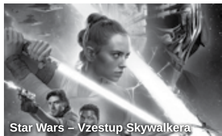
Star Wars – Vzestup Skywalkera

A mezi svátky se znovu vydáme do světa Star Wars . Lucasfilm a režisér J. J. Abrams totiž znovu spojili své síly, aby diváky vzali na epickou výpravu do předaleké galaxie ve filmu Star Wars: Vzestup Skywalkera . Ve strhujícím závěru stěžejní ságy Skywalkerů se zrodí nové legendy a odehraje se konečný boj za svobodu galaxie. Film uvedeme hned dvakrát a jak je již u nás zvykem, na své si přijdou jak milovníci originálního znění s titulky, tak i ti, kteří dávají přednost českému dabingu.