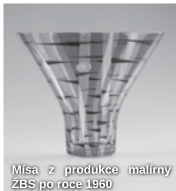
Mísa z produkce malířny ŽBS po roce 1960