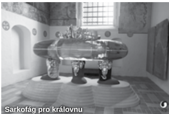
Sarkofág pro královnu

kterém jsou vymodelovány dvě postavy v nadživotní velikosti symbolizující prázdnotu moci. Kříšťálová podstata pak otevřenost a demokratizaci vládnutí. Po několika letech diskusí o záměru a jeho financování začal Bjørn Nørgaard hledat, kdo by dokázal odlít sochu složenou ze šesti tunových kusů taveného čirého skla. Pět let experimentoval