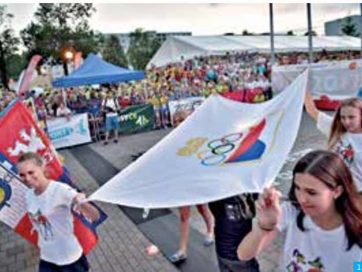
1-5 | Olympiáda dětí a mládeže bude v letošním roce největší sportovní událostí v našem kraji i České republice.