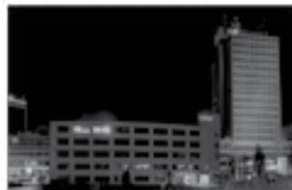
Liberecký kraj svou noc podpořil při osvětlení.

Do modré barvy se v noci z 2. na 3. dubna oděla budova sídla Libereckého kraje, který se tak opět zapojil do kampaně „Česko svítí modře“. Kampaně na podporu povědomí společnosti o problematice autismu poběží až do konce dubna. Více informací se dozvíte na: www.cadep.govasismas.cz/osveta/crako-sviti-modre/duben-2014/ .