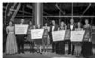
Benefiční ples přehledně hodnotil Libereckého kraje se sponzory (zpravo vlevo):

Již 14. benefiční ples hejtmána Libereckého kraje, tentokrát s mottem „Komunikace“, který se uskotočil v prostorách Krajské vědecké knihovny v Liberci v pátek 1. února, opět pomáhal dobré věci. Výbětek plesu ve výši 474 900 korun si rovněž dleme rozdělily čtyři organizace pečující o přístouzné rodiny v Libereckém kraji – firmi charita Česká Lípa - Centrum pro přístouzné rodiny, Centrum Postvě v Liberci, Centrum pro rodinu Náměstí Turnov – Náhradní rodinná péče a Rodina v Centru v Novém Bors. Organizace dostaly finanční dary od sponzorů a neptina také od všech, kteří si zakoupili vstupenku na ples, postvě polovina její ceny byla rovněž věnována obdarovaným organizacím.