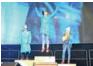
Z medailí na zimní olympiádě se nejčastěji radovala mládež z Libereckého kraje.

Celkem čtrnáct zlatých, patnáct stříbrných a deset bronzových medailí přivezli mladí sportovci z VIII. Her zimní olympiády dětí a mládeže ČR 2018, které se konaly v Pardubickém kraji. Liberecký kraj díky jejich skvělým výsledkům obsadil první místo mezi krajskými reprezentacemi, a to jak v bodovém hodnocení, tak co do počtu cenných kovů. Krajskou reprezentaci tvořilo dohromady 123 osob, z toho 94 sportovců a 29 trenérů. Mladí nadějní sportovci se utkali o medaile i bodová hodnocení v devíti zimních sportech – alpské lyžování, běžecké lyžování, biatlon, krasobruslení, lední hokej, lyžařský orientační běh, rychlobruslení, skicross, snowboarding a dvou doprovodných disciplínách – taneční soutěž a šachy. Mladí sportovci nasadili latku velmi vysoko, bude to pro ně velká výzva, protože Liberecký kraj převzal pomyslnou štafetu a bude pořadatelem letních olympijských her dětí a mládeže v roce 2019.