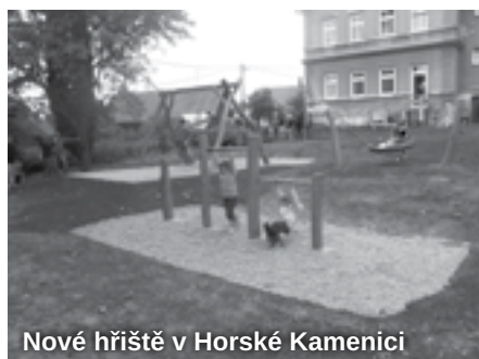
Nové hřiště v Horské Kamenici

Je obecně známo, že jednou z preventivních činností proti nemocem je sport, zvláště u dětí. Poté, co jsme nedávno otevřeli dětské hřiště v Horské Kamenici, chystáme další dětské hřiště vedle fary. A debatujeme nad prostory, kde by výhledově mohla probíhat podobná činnost.