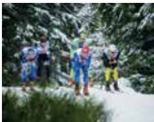
Jizerská padesátka se od roku 1971 (4. ročník závodu) běhá jako Memorál Expedice Peru 1970, kde zabývala celá výprava českých horolezců, spoluzakladatelů závodu. Čest jejich památce.

Již 51. ročník nejslavnějšího běžeckého závodu České republiky Jizerská padesátka se poběží o víkend 16.–18. února. Tradiční sportovní událost i v letošním roce podpoří Liberecký kraj jako jednu z patnácti nejvýznamnějších sportovních a společenských akcí v Libereckém kraji. Hlavní závod ČEZ Jizerská padesátka startuje v neděli 18. února v 9.30 hodin. Více informací o dalších závodech a doprovodném programu najdete na www.jiz50.cz .