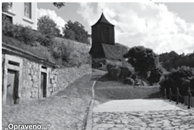
Fotosoutěž Brody v Brodě – soutěžní fotografie Marty Čermákové