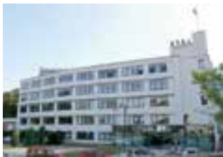
Budova „E“ Krajského úřadu Libereckého kraje – Evropský dům po rekonstrukci.

Rekonstrukce Evropského domu byla zahájena v dubnu loňského roku a trvala 52 týdnů. Původní cena rekonstrukce dle soutěže jako cena smluvní byla ve výši 76 733 244 Kč bez DPH. Vícepráce za celý průběh stavby jsou ve výši 5 266 382 Kč a méněpráce ve výši 2 125 711 Kč, z čehož vyplývá, že absolutní nárůst ceny díla je ve výši 3 140 671 Kč, což představuje 4,09 %. Více informací na evropskydum.kraj-lbc.cz .