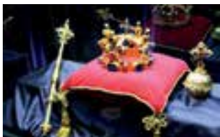
Replika Českých korunovačních klenotů.

Na zámku Hrubá Skála jsou do 28. září k vidění repliky korunovačních klenotů v rámci výstavy České korunovační klenoty na dosah. Výstava se koná k výročí 670 let od korunovace Karla IV. českým králem. Autorem replik korunovačních klenotů je jeden z nejlepších českých zlatníků Jiří Urban z Turnova. Výstava je otevřená denně kromě pondělí od 10 do 16,30 hodin. Organizované skupiny nad 20 osob je třeba ohlásit telefonicky a rezervovat si čas vstupu. Více informací je uveřejněno na www.ceskekorunovackiklenoty.cz .