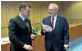
Hejtmán daroval prezidentovi broušenou karafu s rytím motivem českého dvoucasého lva od firmy Halama Železný Brod naplněnou jeho domácí hruškovici.