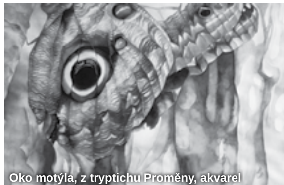
Oko motýla, z tryptichu Proměny, akvarel