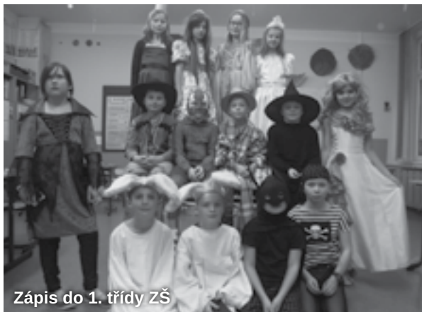
Zápis do 1. třídy ZŠ

Druhé pololetí školního roku na naší škole začalo rušně. Svoji návštěvou nás poctila Česká školní inspekce. Zaměřila se na komplexní kontrolu školy, která zahrnovala hodnocení výuky, bezpečnosti, materiálního vybavení, přezkoumání veškeré dokumentace školy, finančního hospodaření, personálního obsazení, činnosti jídelny a školní družiny a v neposlední řadě se zúčastnila zápisu dětí do prvního ročníku.