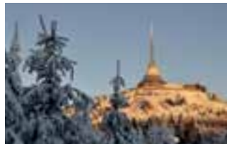
Liberecký kraj aktivně usiluje o zapsání národní kulturní památky Horský hotel a televizní vysílací Ještěd do seznamu památek UNESCO.

Zima, hory a sníh patří neodmyslitelně k sobě. Vzhledem ke svému hornatému rázu toto všechno Liberecký kraj nabízí a je tak ideálním místem pro zimní dovolenou. Zasnežené vrcholky našich hor snad nechávají v klidu žádnou romantickou duši.