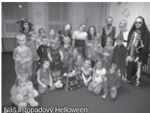
Náš listopadový Halloween