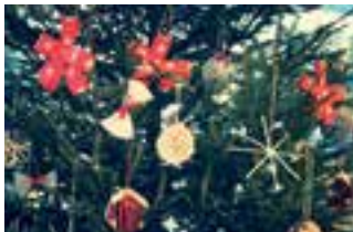
Stejně jako dětem z dětských domovů přejeme také našim čtenářům klidné prožití vánočních svátků a hodně zdraví, štěstí a spokojenosti v Novém roce.