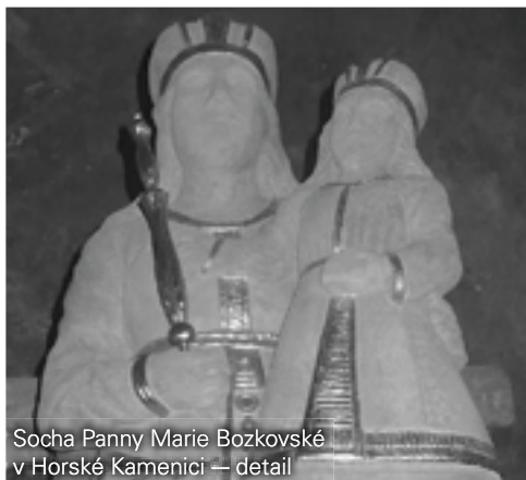
Socha Panny Marie Bozkovské v Horské Kamenici — detail

Zimní údržbu silnic I. třídy v Libereckém kraji zajišťuje a je za ni odpovědná společnost EUROVIA CS, a. s. na základě Smlouvy o poskytnutí služeb Provádění zimní a běžné letní údržby silnic I. třídy v Libereckém kraji, kterou uzavřelo Ředitelství silnic a dálnic ČR a EURO-