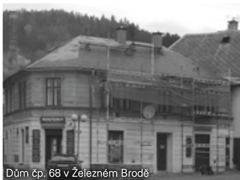
Dům čp. 68 v Železném Brodě

V loňském roce byla zahájena obnova střešního pláště domu čp. 68 v Železném Brodě (hospoda U Kaštáků). V severovýchodní části domu byla sejmuta stávající eternitová krytina a položeno nové bednění s břidlicovou krytinou. Na obnovu vlastníci získali příspěvek z Programu péče o vesnické památkové rezervace a zóny a krajinné památkové zóny ve výši 300 000 Kč.