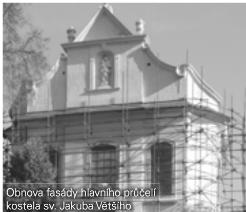
Obnova fasády hlavního průčelí kostela sv. Jakuba Většího

V kostele sv. Jakuba Většího v Železném Bro-