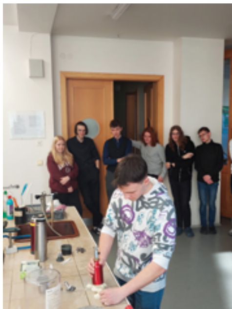
SUPŠS, Výuková spolupráce s firmou Cryture, str. 34