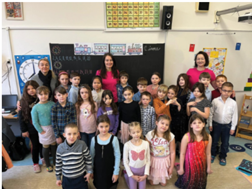
ZŠ Školní, 2. B – projekt Abeceda peněz, str. 30