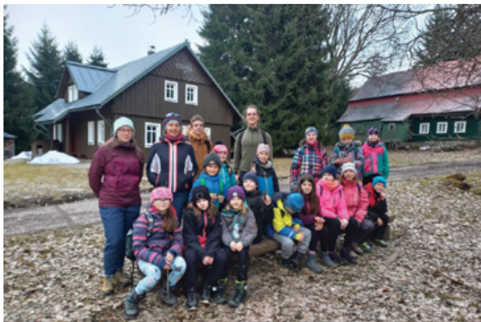
SVČ Mozaika, Jarní lyžařský tábor, str. 35