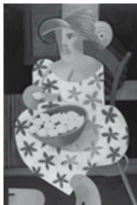
Prodavačka citrónů, 2017

Svá díla představila řadou samostatných i kolektivních výstav, věnuje se převážně abstraktní tvorbě. Jejím hlavním tématem je svět lidí s mnohdy komplikovanými vztahy.