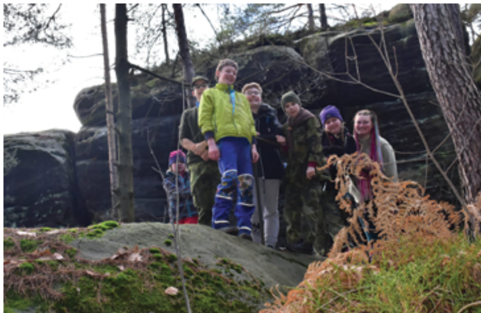
Skauti, Výlet do Besedických skal, str. 38