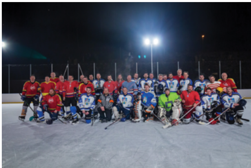
HC Železný Brod, exhibice 2. 3., str. 42