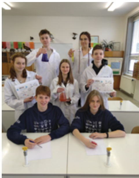
ZŠ Školní, Vítězové olympiád (Chemie, Český jazyk), str. 31