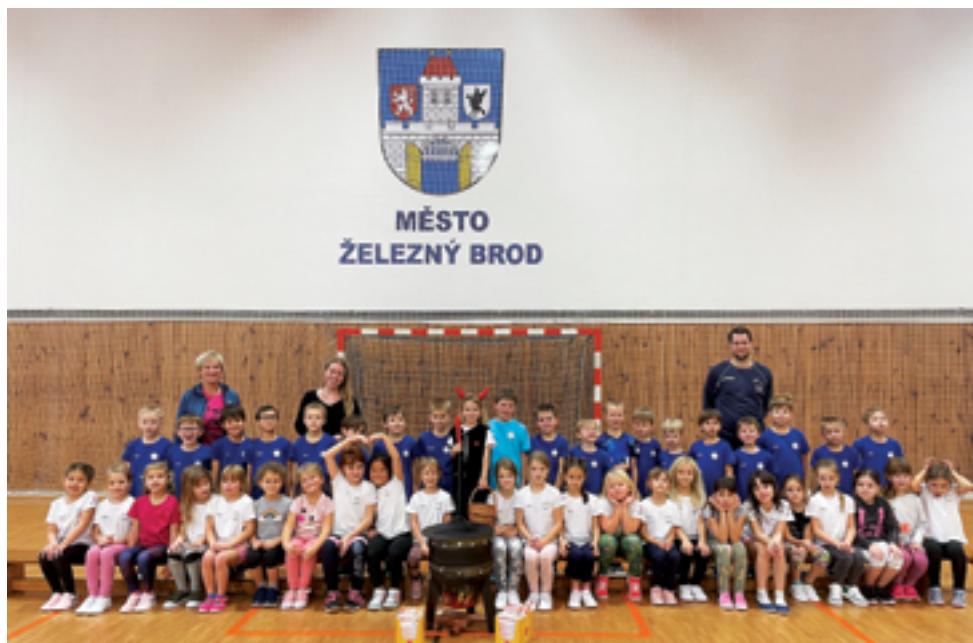
ZŠ Školní, Mikulášský trojboj, str. 26.