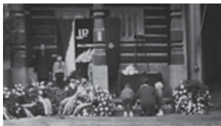
Podloubí spořitelny v lednu 1969

V Železném Brodě, v den pohřbu Jana Palacha, byla uspořádána studenty sklářské školy trýzna. V podloubí spořitelny byla instalovaná deska s jeho monogramem a datem úmrtí. U desky stály čestnou stráž zdejší studenti a skauti ze železnobrodského junáckého střediska. Improvizované pietní místo bylo zaplaveno věnci a květinami od pracovníků továren, institucí i od běžných občanů.