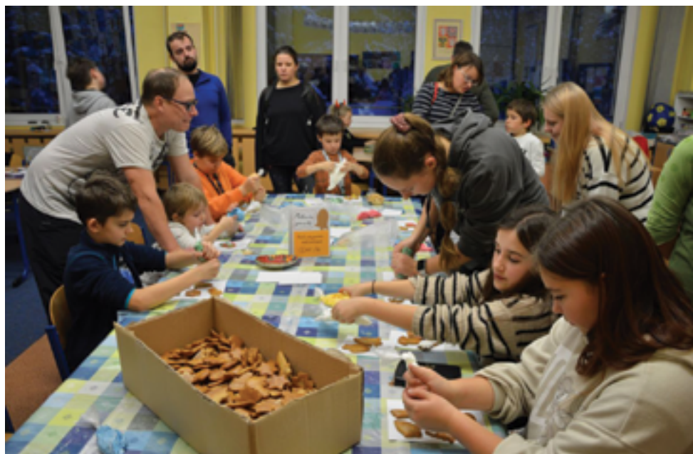
ZŠ Pelechovská, Vánoční dílničky, str. 25.