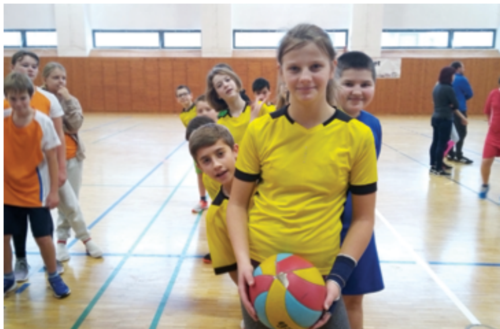
ZŠ Školní, okrskové kolo přehazované, str. 26.