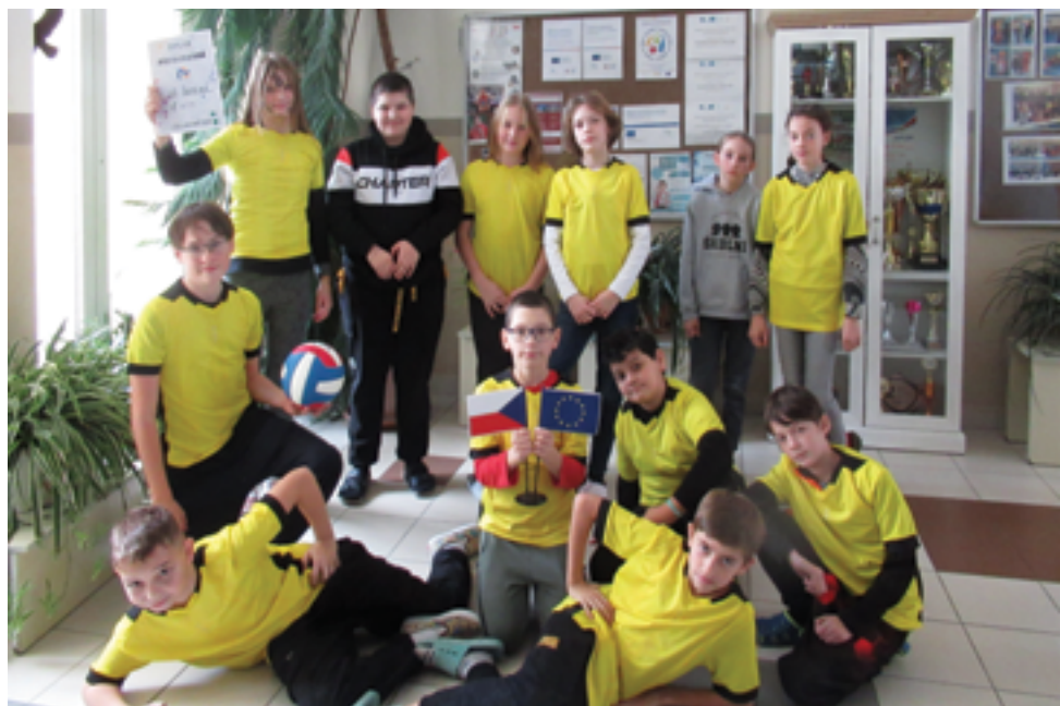
ZŠ Školní, Okrskové kolo přehazované, str. 26.