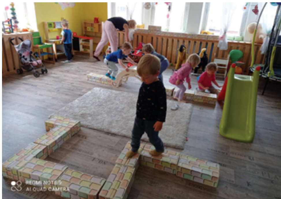
RC Andělek, Herníčky, str. 34.