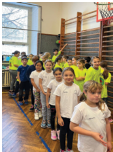
FSA J. Boučkové, Hry všestrannosti, str. 37.