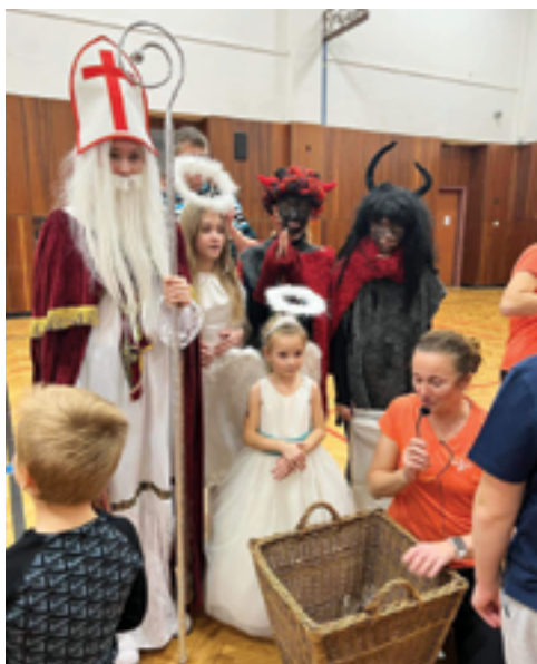
FSA Mikulášský trojboj, str. 37.