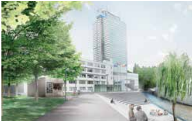
Vítězný návrh podoby dolního centra Liberce s přístupem k řece Nise od re:architekti studio s.r.o.

Liberecký kraj představil veřejnosti novou podobu dolního centra Liberce. Soutěž o architektonický návrh rekvizice a úpravy okolí budovy krajského úřadu v Liberci vypsal Liberecký kraj v letošním roce. Do soutěže se přihlásilo celkem deset architektonických návrhů, z nichž porota, složená z odborníků architektury a zástupců Libereckého kraje, vybrala dva. Autorem prvního návrhu je pražské re:architekti studio s.r.o., druhé místo patří liberecké společnosti SIAL architekti a inženýři spol. s r.o. Zadáním pro všechny návrhy bylo zpracování architektonicko-krajinářského návrhu úprav veřejného prostranství v okolí sídla Krajského úřadu Libereckého kraje. Hlavním požadavkem bylo začlenění budovy kraje, kultivace jejího okolí, které je výrazným, ale nedůstojným prostorem dolní části centra Liberce. Dalším požadavkem bylo zajištění přístupu k řece Nise lidem.