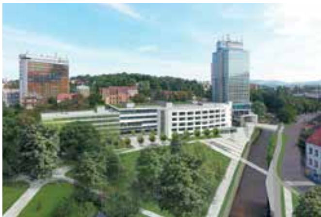
Návrh od SIAL architekti a inženýři spol. s r.o., který získal druhou cenu.