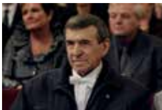
František Peterka obdržel v roce 2009 Poctu hejtmána Libereckého kraje.

Smutná zpráva zastihla milovníky Krkonoských pohádek v pátek 25. listopadu, kdy ve věku 94 let odešel představitel Krakonoše – František Peterka. Přes dvě stovky smutečních hostů se s ním naposledy rozloučilo v obřadní síni libereckého krematoria ve čtvrtek 1. prosince 2016. Herec libereckého Divadla F. X. Šaldy se ve filmových rolích začal objevovat už v 50. letech, nejvíce se však proslavil v letech 70. a 80., a to ve snímcích Jáchyme, hoď ho do stroje , Zítro to roztočíte, drahoušku , Co je doma, to se počítá nebo Příště budete chytřejší, staroušku! Nejvíce však vešel do povědomí jako Krakonoš v Krkonoských pohádkách . ←