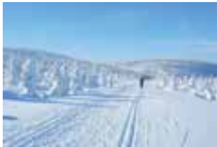
Zasněžování běžeckých stop pomůže nejen běžkařům, ale také organizátorům Jizerské padesátky.

„Podporujeme tento projekt, protože umožní přivést do regionu investici, která je dlouhodobě potřebná. Podmínkou k poskytnutí dotace je koфинancování projektu z dalších zdrojů a Liberecký kraj je přirozeným partnerem obce