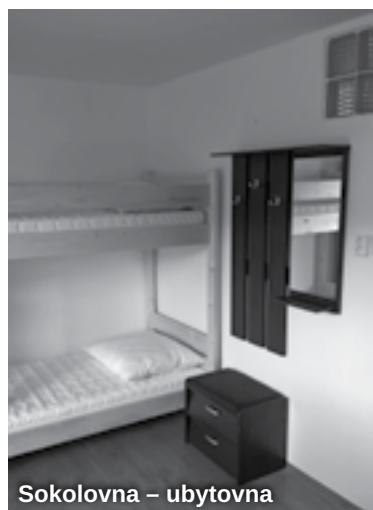
Sokolovna – ubytovna

Velkou akcí (v poměrech roku 2016) je vybudování dešťové kanalizace, odvádějící dešťové vody ze střech sportovní haly a sokolovny. Vyřeší se tím stávající neustálé svádění vod ze střech k základům objektu. Další „kanalizací“ upravenou v loňském roce bylo odvodnění hasičské nádrže v Horské Kamenici, kde byl odtok z této nádrže zcela rozpadlý, a proto bylo vyměněno potrubí.