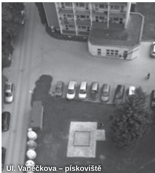
Ul. Vaněčkova – pískoviště

podařilo se dokončit drobné úpravy a celou tuto akci, podpořenou Regionálním operačním programem NUTS II Severovýchod, zkolaudovat. Ve vztahu k podmínkám dotace bylo nutno do konce července provést několik drobných úprav a požádat úřady o závěrečnou kolaudaci stavby. Díky tomuto úkonu nebylo nutno vrátit poskytnutou dotaci, resp. se částka odvodu zmenšila na „zanedbatelných“ 5 000 Kč. V letošním roce nás bude ještě čekat vyřešení vody, kapající za krk cestujícím při nástupu do autobusů na zastávce U sokolovny. Další úspěšnou „akcí“ bylo získání kolaudačního souhlasu na regeneraci sídliště Vaněčkova, kdy byla dořešena problematická kanalizace. Na Vaněčkově ulici se podařilo opravit a zmodernizovat pískoviště, ke kterému by se měly vybudovat ještě přístupové chodníky.