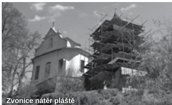
Zvonice nátěr pláště

kteří přispěly ke zlepšení žití ve městě. Byla např. opravena cesta Záskalím, která byla vyasfaltována téměř v celé délce od „kamenické“ silnice až pod sádky. Opravou prošla i komunikace „Hranicemi“, která byla poškozena po těžbě dřeva a účinností letošních dešťů. Společně s firmou TFnet s. r. o. byl vyměněn povrch chodníku na části nábřeží Obránců míru od mostu k Malému náměstí. Původní rozlámaný asfalt nahradily dlažební kostky.