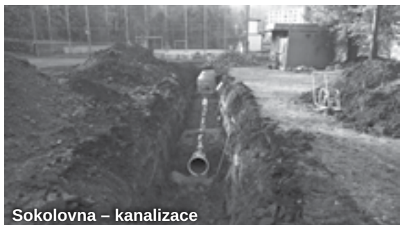
Sokolovna – kanalizace

Další významnou letošní akcí byla úprava ubytovny v sokolovně, kdy byly vylepšeny první tři pokoje, bylo tak výrazně zlepšeno prostředí pro ubytované. Celkovou rekonstrukcí prošlo přilehlé sociální zázemí sloužící nejen ubytovaným ale i cvičencům na tzv. malém sále. Sokolovna v Jirkově se na počátku roku