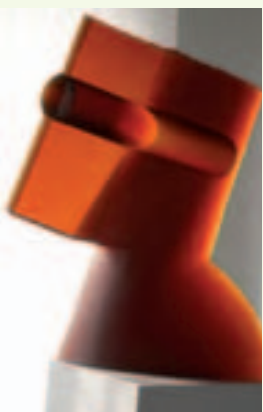
Městské muzeum Železný Brod