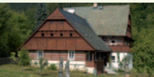
Bělíště, Železný Brod

Možnost zkrácení: z Malé Skály nebo z Lišného vlakem či busem