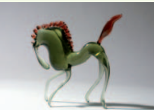
Městské muzeum, Železný Brod

ŽELEZNÝ BROD – město leží v sevřeném údolí Jizery, založeno bylo ve 12. stol. u někdejších zemských stezek při brodu přes řeku. V okolí se od 14. stol. těžila železná ruda a břidlice, v 19. stol. vyniklo sklářství a rozvinula se textilní výroba. V r. 1920 vznikla sklářská škola (expozice přístupná během prázdnin), Železný Brod se stal nejen městem starých památek, ale také městem skla a skleněné bižuterie, což ho proslavilo po celém světě. I dnes je možné navštívit sklářské dílny. Z památek je třeba zmínit kostel svatého Jakuba Většího, vystavěný v r. 1649, upravený ve 2. pol. 18. stol., kdy byla vedle něj postavena i dřevěná zvonice, dále kašnu se sochou Panny Marie Immaculaty na náměstí, kostelík sv. Jana Nepomuckého na Poušti, postavený hrabětem Karlem Josefem Des Fours. Ke skvostům architektury horního Pojizeří patří staré roubené domy, stojící převážně v oblasti Trávníky (památková rezervace, naučná stezka). Největší a nejcennější roubený objekt je Bělíště, které slouží národopisné expozici Městského muzea. To sídlí na náměstí v budově, vzniklé r. 1936 zapojením neporušeného průčelí roubeného objektu Klemencovsko do moderní budovy spojitelné. Je zde umístěna také sklářská expozice a unikátní galerie světoznámých sklářských výtvarníků J. Brychtové a S. Libenského. V budově radnice je Městská galerie Vlastimila Rady, na nábřeží Městské koupaliště,