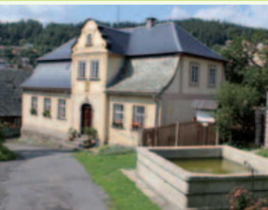
Trávníky, Železný Brod