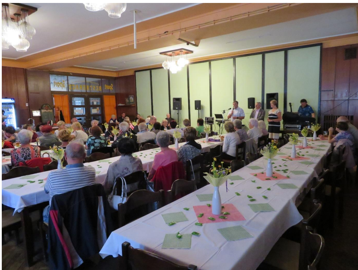
Fotografie z akce pro seniory: „Posezení dříve narozených“ konané dne 28.06.2018